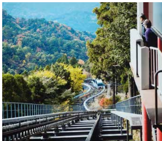
英彦山スロープカー神駅からの眺望