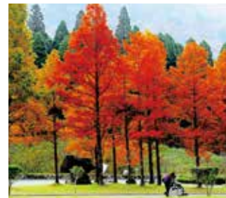
英彦山青年の家の紅葉