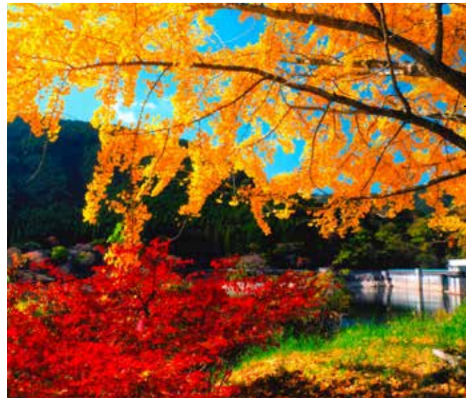
油木ダム周辺の紅葉