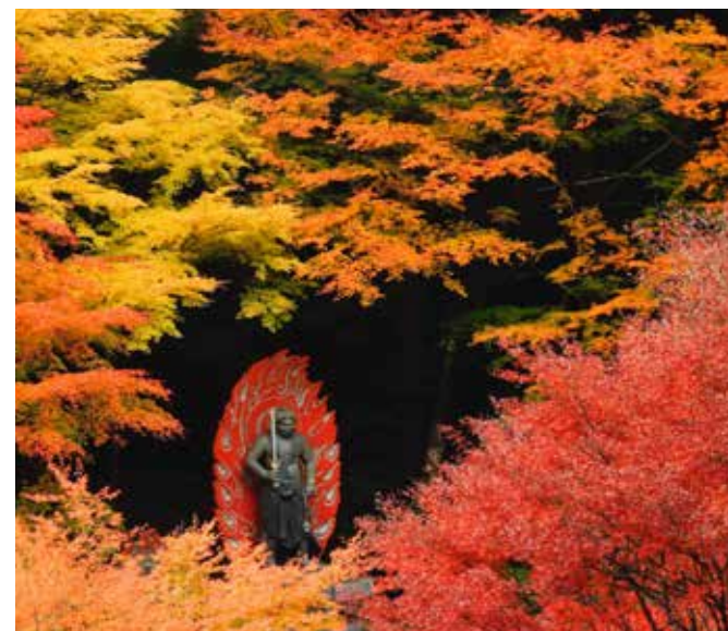
英彦山大権現 湯の谷別院の紅葉