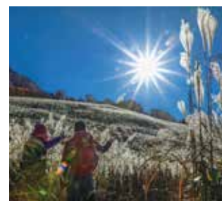
鷹巣原高原のススキ