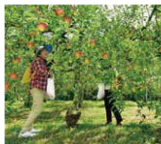
英彦山観光りんご園