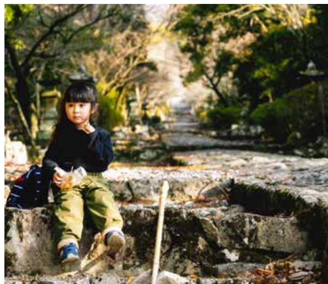
英彦山神宮表参道

カラフルな英彦山の 秋を見つけに行こう!! 秋は英彦山がとってもカラフル! 今回掲載の写真は添田町が例年行っている フォトコンテストの受賞作品です。 ご覧のように、秋の英彦山の魅力が一目でわかります。 美しい景色を見ると思わず写真を撮りたくなりますよね。 ドライブもよし、ピクニックや散策もよし、あなたのスタイルで カラフルな英彦山の秋を見つけにお越しください。