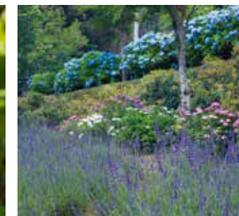
英彦山花園のラベンダーとアジサイ