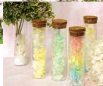
アジサイのドライフラワー