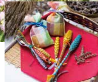
ラベンダースティック&ポプリ