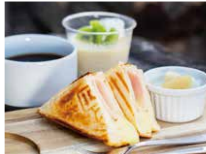
Cafe Cairn かふえ けるん

英彦山花園の近く、参道の長三洲跡地にて、カフェを営業しています。参道の散策に疲れたら、自然を感じられるテラス席でひと休みしませんか。