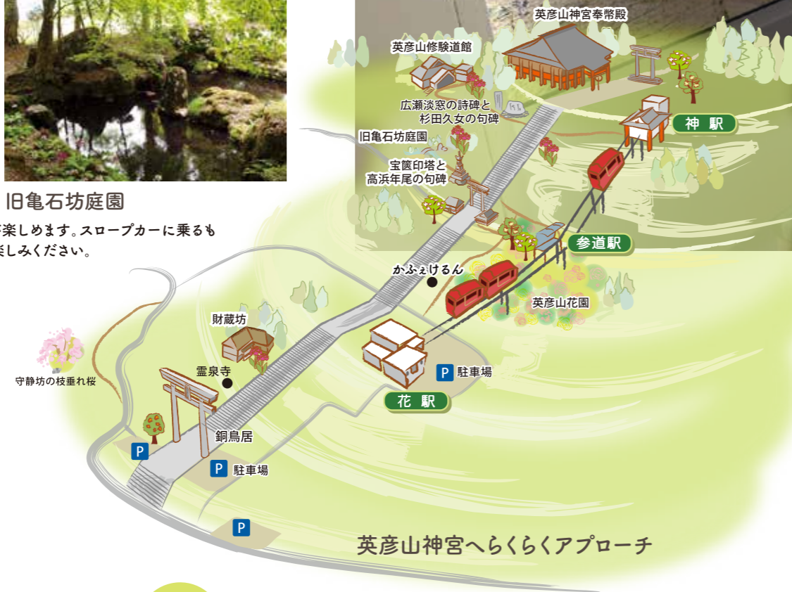
英彦山神宮へらくらくアプローチ

英彦山神宮へどなたでも手軽に参拝ができるように平成17年に英彦山スロープカーが開通して18年、デザインも新たに新型車両がデビューしました。車両や駅舎全てバリアフリーになっていきますので、車椅子やベビーカーご利用のお客様も安全にご利用いただけます。皆様のご利用、お待ちしております。