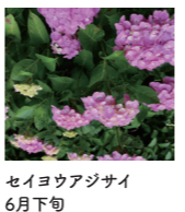
セイヨウアジサイ 6月下旬