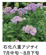
石化八重アジサイ 7月中旬~8月下旬

スロープカー花駅と参道駅間の傾斜地、総面積17,000平方メー トルの広大な敷地に、添田町の花「ツクシジャクナゲ」を始め、アジ サイ類、ラバンディン系ラベンダー、その他、英彦山三名花のオオヤ マレンゲやヒコサンヒメシヤラなど高山植物を中心に 70種類以 上、3万2千本以上の花木を植樹しています。