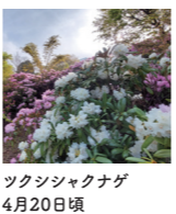
ツクシジャクナゲ 4月20日頃