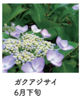
ガクアジサイ 6月下旬