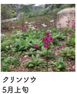
クリンソウ 5月上旬