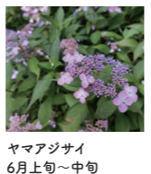
ヤマアジサイ 6月上旬~中旬