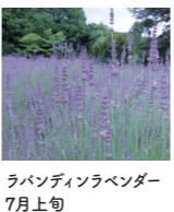
ラバンディンラベンダー 7月上旬