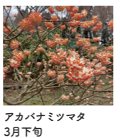
アカバナミツマタ 3月下旬