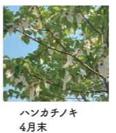
ハンカチノキ 4月末