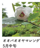
オオバオオヤマレンゲ 5月中旬