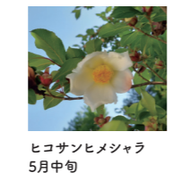
ヒコサンヒメシヤラ 5月中旬